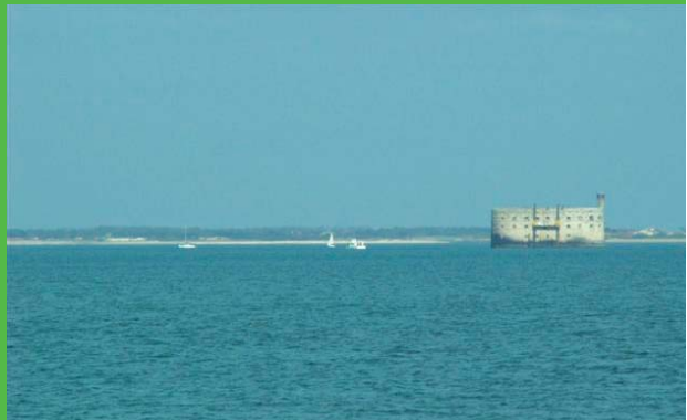
Pointe des Saumonards

André GENDRON 110 rue des Gitonnelles Sauzelle 17190 ST GEORGES D'OLÉRON ☎ 05 46 47 15 22